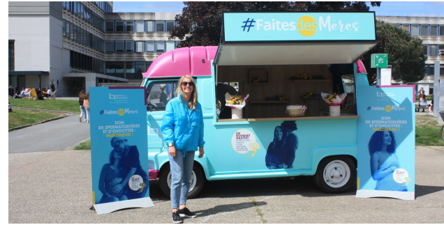
HABILLAGE DE VÉHICULE