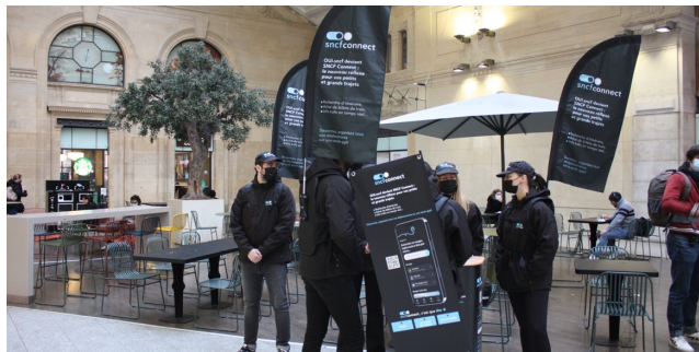
HÔTES ET HÔTESSES